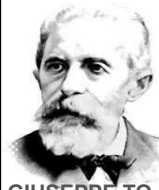
GIUSEPPE TONIOLO, Fondatore delle Settimane Sociali

"Spetta alle comunità cristiane analizzare obiettivamente la situazione del loro paese, chiarirla alla luce delle parole immutabili del vangelo, attingere principi di riflessione, criteri di giudizio e direttive di azione dell'insegnamento sociale della Chiesa". Paolo VI